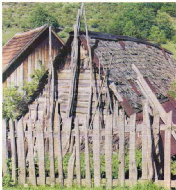
Kuća u koju su dovedeni zarobljeni Hrvati iz Maglica da budu živi spaljeni.