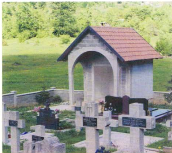
... i nova kapelica.